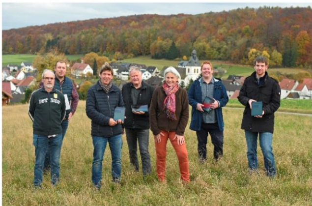
Foto: Auch in Istrup freut man sich auf die Digital-Hilfen durch das LEADER-Projekt Dorf.Zukunft.Digital

Albaxen, Altenheerse, Amelunxen, Bergheim, Bredenborn, Bonenburg, Borgholz, Bökendorf, Drenke, Dringenberg, Erkeln, Eversen, Fölsen, Germete, Godelheim, Großen- und Kleinenbreden, Himmighausen, Holzhausen, Istrup, Löwen, Merlsheim, Niesen, Ottenhausen, Ovenhausen, Rösebeck, Sandebeck, Vörden, Wehrden, Welda und Wormeln.