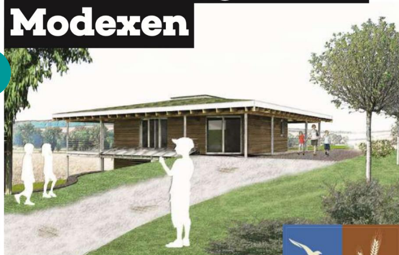
So könnte es nach der Vision der Beteiligten in Modexen bald aussehen. Illustration: Architekten Krekeler & Bohl